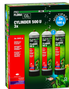
JBL PROFLORA CO2 CYLINDER 500 U 3x

Bouteille à usage unique, remplie de 500 g de CO2