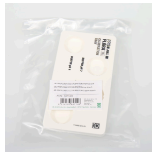
JBL PF CO2 CALIBRATION TRAY Bonne stabilité des éprouvettes pendant l'étalonnage