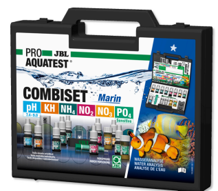
JBL PROAQUATEST COMBISET Marin Coffret de tests pour analyses d'eau en aquarium marin