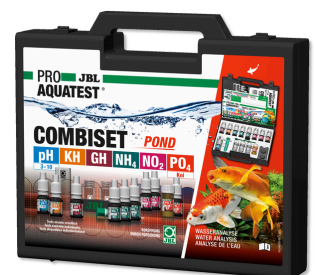
JBL PROAQUATEST COMBISET POND Coffret d'analyses d'eau en bassins