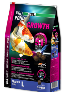
JBL PROPOND GROWTH L

Aliment spécial croissance pour koïs de taille moyenne