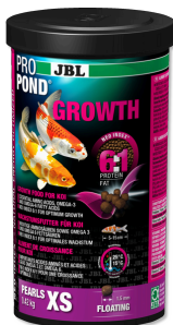
JBL PROPOND GROWTH XS

Aliment spécial croissance pour très petits koïs