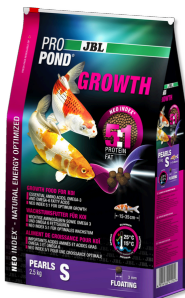
JBL PROPOND GROWTH S

Aliment spécial croissance pour très petits koïs