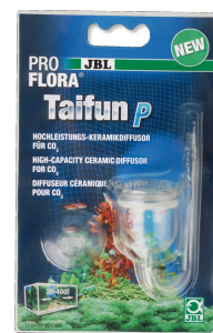
JBL PROFLORA Taifun P Mini-diffuseur de CO2 pour nano-aquarium d'eau douce