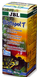
JBL Biotopol T

Aliment complet pour insectes alimentaires