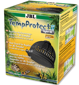
JBL TempProtect II light Protection antibrûlure pour reptiles pour JBL TempSet