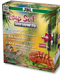
JBL TempSet Unit L-U-W Kit d'installation pour spot à décharge (LUW et HQI)