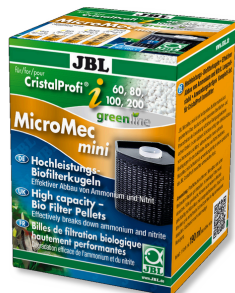
JBL MicroMec CristalProfi i60/80/100/200 Billes de filtration performantes pour CristalProfi