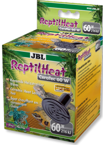
JBL ReptilHeat Spot chauffant en céramique