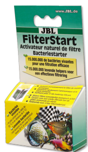
JBL FilterStart Bactéries pour activation des filtres