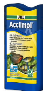
JBL Acclimol Conditionneur d'eau pour l'acclimatation des poissons