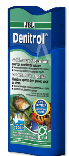
JBL Denitrol Activateur de bactéries pour poissons d'aquariums