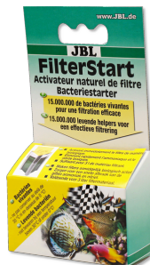
JBL FilterStart Bactéries pour activation des filtres