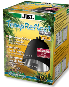
JBL TempReflect light Réflecteur pour lampes basse consommation