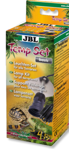
JBL TempSet basic Kit d'installation pour spot de terrarium