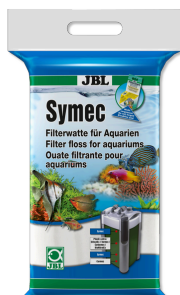
JBL Symec Ouate filtrante Ouate filtrante contre toute turbidité de l'eau