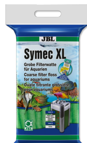
JBL Symec XL Ouate filtrante grossière contre la turbidité de l'eau