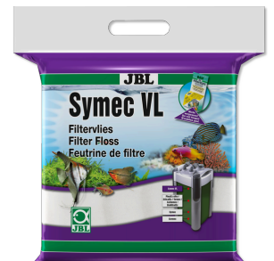
JBL Symec VL Microfibre filtrante contre toutes turbidités de l'eau