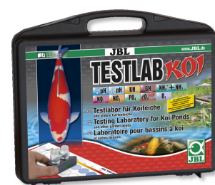
JBL Testlab Koi Coffret de tests professionnel pour bassins