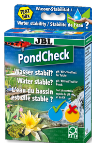
JBL PondCheck Test rapide pour la détermination du pH et du KH