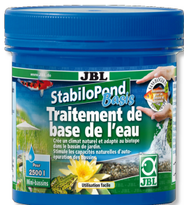
JBL StabiloPond Basis Produit d'entretien de base pour bassins