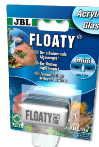
JBL FLOATY Verre/Acrylique Aimant flottant nettoyeur de vitres acryliques