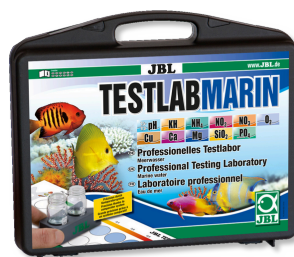
JBL Testlab Marin Coffret professionnel d'analyse de l'eau de mer