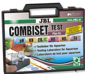
JBL Kit Combiset Test Plus Fe Coffret avec les principaux tests d'eau + test fer