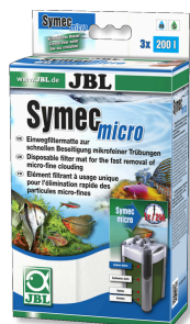
JBL Symec micro Microfibre pour filtre d'aquarium contre l'eau turbide