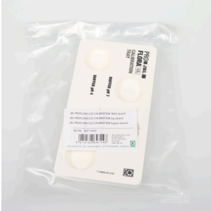
JBL PF CO2 CALIBRATION Tray Para suporte seguro das cuvetes durante a calibração