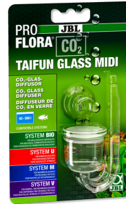
JBL PROFLORA CO2 TAIFUN GLASS Difusor de vidro de CO2 p/ aquários água doce 40-300 l