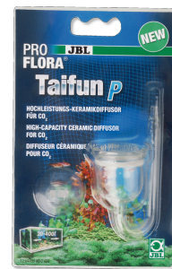
JBL PROFLORA Taifun P Difusor de CO2 mini para nano aquários de água doce