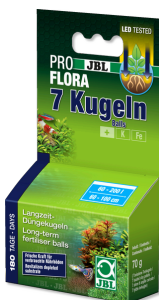
JBL PROFLORA 7 Bolas Fertilizante para raízes para aquários de água doce (7 bolas fertilizantes)