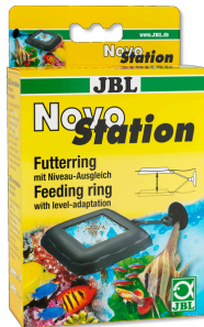
JBL NovoStation Anel de alimentação flutuante, compensa nível de água