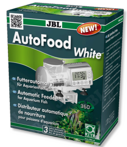
JBL AutoFood WHITE Alimentador automático branco para peixes de aquário