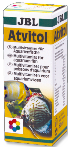
JBL Atvitol Gotas multivitamínicas para peixes de aquário