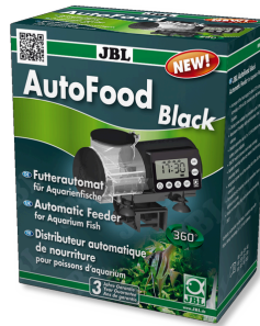
JBL AutoFood BLACK Alimentador automático preto para peixes de aquário