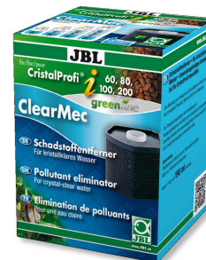
JBL ClearMec CristalProfi i60/80/100/200

Cartucho eliminação de fosfato para JBL CristalProfi i