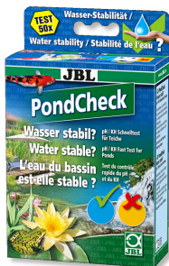
JBL PondCheck Teste rápido para determinação dos valores pH e KH