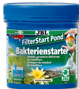
JBL FilterStart Pond Aceleradores biológicos para filtros de lago de jardim