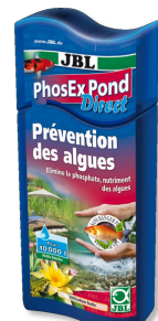
JBL PhosEX Pond Direct Eliminador de fosfato para lagos de jardim