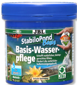
JBL StabiloPond Basis Produto de cuidados básicos para lagos de jardim