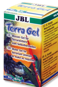
JBL TerraGel Gel de água para animais de terrário