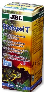
JBL Biotopol T Condicionador de água para terrários