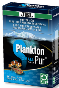
JBL PlanktonPur SMALL Petisco para peixes pequenos de aquário