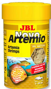
JBL NovoArtemio Alimento suplementar de artémia para peixes de aquário