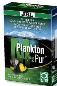
JBL PlanktonPur MEDIUM Petisco para peixes grandes de aquário