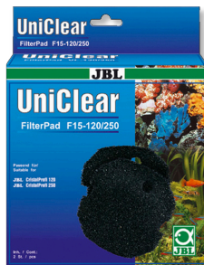
JBL FilterPad F15 Espuma grossa para filtros de aquário CristalProfi