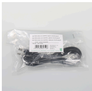
JBL PF CO2 CONTROL Kabel do VALVE