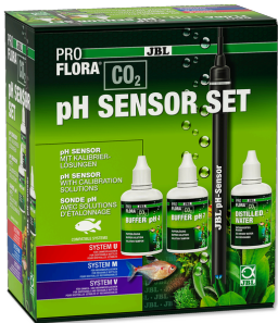
JBL PROFLORA CO2 pH ZESTAW CZUJNIKÓW Elektroda pH jakość labor.do prawie wszystkich urz.pH