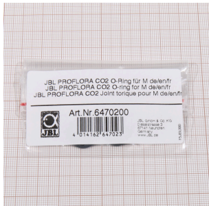
JBL PROFLORA CO2 O-Ring do M