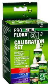
JBL PROFLORA CO2 ZESTAW DO KALIBRACJI Do kalibracji i przechowywania elektrod pH