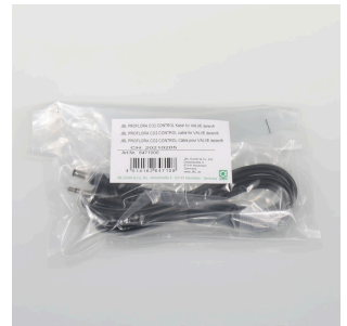
JBL PF CO2 CONTROL Kabel do VALVE