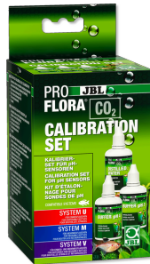
JBL PROFLORA CO2 ZESTAW DO KALIBRACJI Do kalibracji i przechowywania elektrod pH