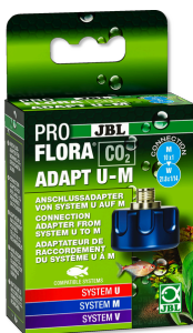
JBL PROFLORA CO2 ADAPT U - M PrzejściówkaCO2 do przezbrojenia butli jedn. wielokr