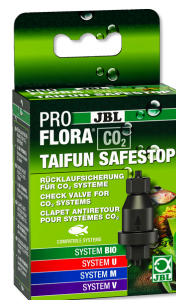
JBL PROFLORA CO2 TAIFUN SAFESTOP Zawór zwrótny do instalacji CO2