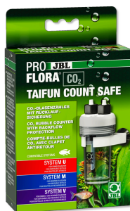
JBL PROFLORA CO2 TAIFUN COUNT SAFE Licznik bąbelków CO2 z wbudowanym zaworem zwrótnym