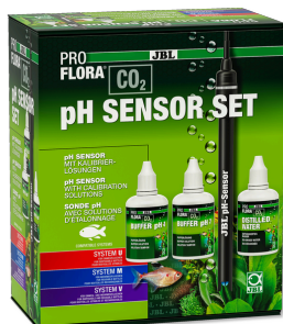
JBL PROFLORA CO2 pH ZESTAW CZUJNIKÓW Elektroda pH jakość labor. do prawie wszystkich urz. pH