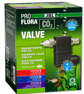
JBL PROFLORA CO2 VALVE CO2-zawór magnetyczny do kontrolowanego podawania CO2