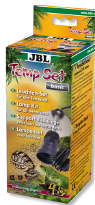
JBL TempSet basic Zestaw instalacyjny do promienników do terrariów