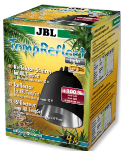
JBL TempReflect light Klosz-odbłyśnik do żarówek energooszczędnych