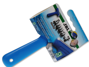
JBL Aqua-T Handy Czyścik do szyb z ostrzem ze stali szlachetnej