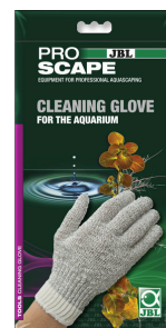
JBL PROSCAPE CLEANING GLOVE Rękawica do akwariów do czyszczenia