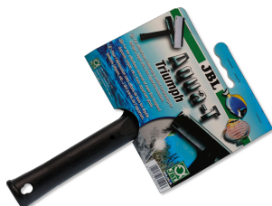
JBL Aqua-T Triumph Czyścik do szyb z ostrzem ze stali szlachetnej i gumowym skrobakiem