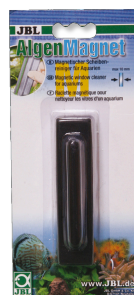
JBL Magnes do glonów Czyścik magnetyczny do szyb akwariowych