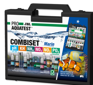
JBL PROAQUATEST COMBISET Marin Walizka do testów do analizy wody w akwariach morskich