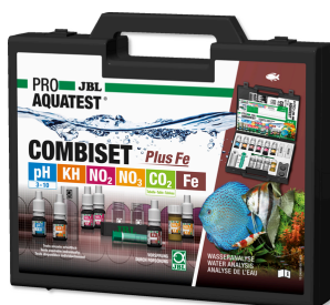
JBL PROAQUATEST COMBISET Plus Fe Walizka do testów z najważniejszych testami wody + test żelaza