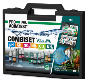
JBL PROAQUATEST COMBISET Plus NH4 Walizka do najważniejszych testów wody + NH4-Test