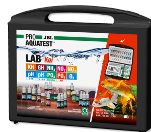
JBL PROAQUATEST LAB Koi Profesjonalna walizka testów do stawu Koi i ogrodowego