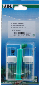
JBL Zestaw części do testów wody