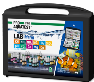
JBL PROAQUATEST LAB Marin Profesjonalna walizka testów do analizy wody morskiej