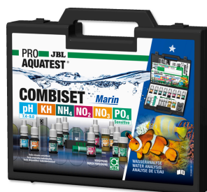
JBL PROAQUATEST COMBISET Marin Walizka do testów do analizy wody w akwariach morskich