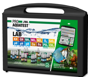
JBL PROAQUATEST LAB Walizka z 13 testami do analizy słodkiej wody