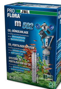
JBL PROFLORA m502 Instalacja do nawożenia CO 2 roślin akwar z wył na noc