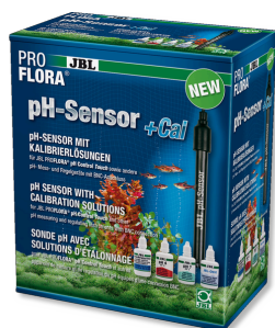
JBL PROFLORA czujnik pH+Cal Elektroda PH z przyłączem BNC