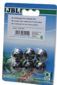
JBL Przyssawka z rowkiem 2 mm

Uchwyt do kabla grzewczego do akwariów i terrariów