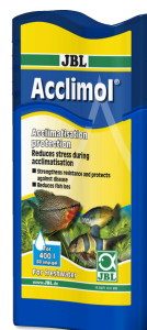
JBL Acclimol Preparat do uzdatniania wody do aklimatyzacji nowych ryb