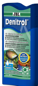
JBL Denitrol Startery bakteryjne do wpuszczenia ryb akwariowych