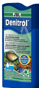
JBL Denitrol Startery bakteryjne do wpuszczenia ryb akwariowych