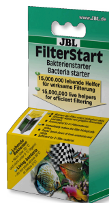
JBL FilterStart Bakterie do aktywacji filtrów