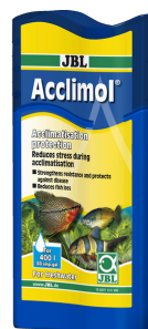
JBL Acclimol Preparat do uzdatniania wody do aklimatyzacji nowych ryb