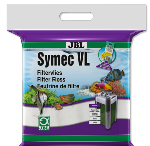
JBL Symec VL Włókna filtracyjna do filtrów akwariowych przeciwko wszystkim zmętnieniom wody