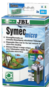
JBL Symec micro Mikrowłókna do filtrów akwariowych przeciwko zmętnieniom wody