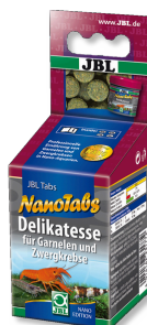
JBL NanoTabs Pokarm podstawowy dla krewetek i rączków karłowatych