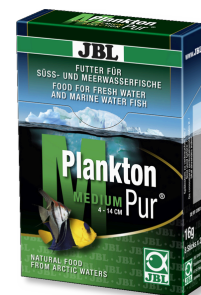
JBL Plankton Pur MEDIUM Smakołyk dla dużych ryb akwariowych