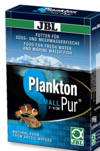
JBL Plankton Pur SMALL Smakołyk dla małych ryb akwariowych