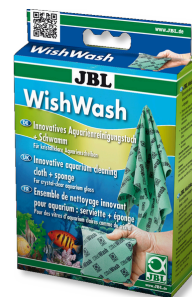
JBL WishWash Ścierka do czyszczenia i gąbka