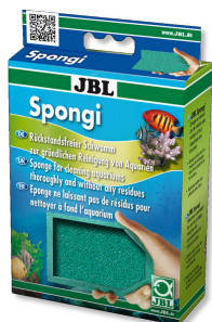
JBL Spongi Gąbka do czyszczenia do akwariów i terrariów