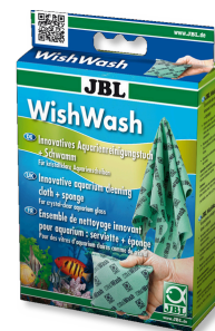
JBL WishWash Ścierka do czyszczenia i gąbka