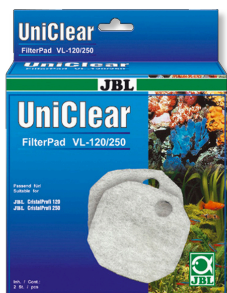
JBL FilterPad VL Wata filtracyjna do filtrów akwariowych CristalProfi