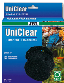
JBL FilterPad F15 Gruboporowata pianka do filtrów akwariowych CristalProfi