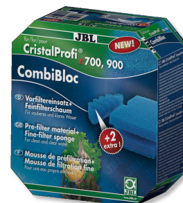
JBL CombiBloc CristalProfi e Wkłady do przedfiltra i Gąbka do CristalProfi e