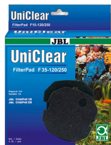
JBL FilterPad F35 Drobnoporowata pianka do filtrów akwariowych CristalProfi