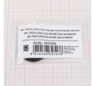
Juego de juntas JBL PF CO2 INLINE