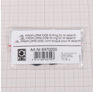
JBL PROFLORA CO2 Junta tórica para M