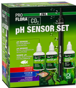
JBL PROFLORA CO2 pH SENSOR SET Electrodo de pH, calidad de laboratorio, uso universal