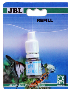
Test JBL pH 7,4-9,0 Test de pH para acuarios y estanques entre 7,4-9,0