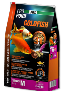
JBL PROPOND GOLDFISH M

Alimento en barras para carpas doradas pequeñas