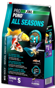
JBL PROPOND ALL SEASONS S

Alimento 4 estaciones para kois/peces estanq. pequeños