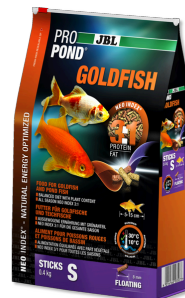
JBL PROPOND GOLDFISH S

Alimento 4 estaciones para kois y peces de estanque