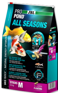
JBL PROPOND ALL SEASONS M

Alimento 4 estaciones para kois/peces estanq. pequeños