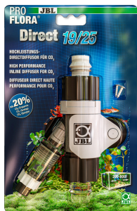
JBL PROFLORA Direct Difusor directo de alto rendimiento para CO2